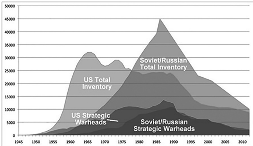
Figur 2: US/Soviet-Russian nuclear warheads 1945-2010: Lastet ned 14.11.2014 fra www.fas.org/blog/ssp/2009/04/usrusnukes.php .

Men man skal legge merke til at det ikke er alle våpen som «teller» i henhold til den nyeste Start-avtalen. Eksempelvis eksisterer det fremdeles flere tusen taktiske atomvåpen, som ikke er regulert. I tillegg er det urovekkende at antallet russiske, strategiske stridshoder har økt i perioden 2013–2014 for første gang siden den kalde krigen.