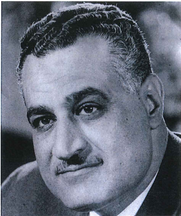
Gamal Abdel Nassers panarabiske politikk kom i perioder i klem mellom supermaktinteressene, men han viste i det minste at det fantes selvstendige politiske aktører utenfor kretsen av de tradisjonelle stormaktene.

I september 1954 publiserte oberstløytnant Nasser boken Philosophy of the Revolution som skisserer hans regionale mål og ambisjoner: "...leadership of the Arab world, the elimination of the "white man" from the Middle East and Africa, and a universal Islamic Empire with limitless power, a Pan-Arab state from the Strait of Gibraltar to the Indian Ocean". 3 Etter Det Muslimske Brorskapets mordforsøk på Nasser 26. oktober 1954, ble president general Naguib satt i husarrest og Nasser ble den ubestridte lederen av Egypt. Målene Nasser hadde beskrevet i sin bok ble dermed videreført som Egypt sine mål, mer eller mindre.