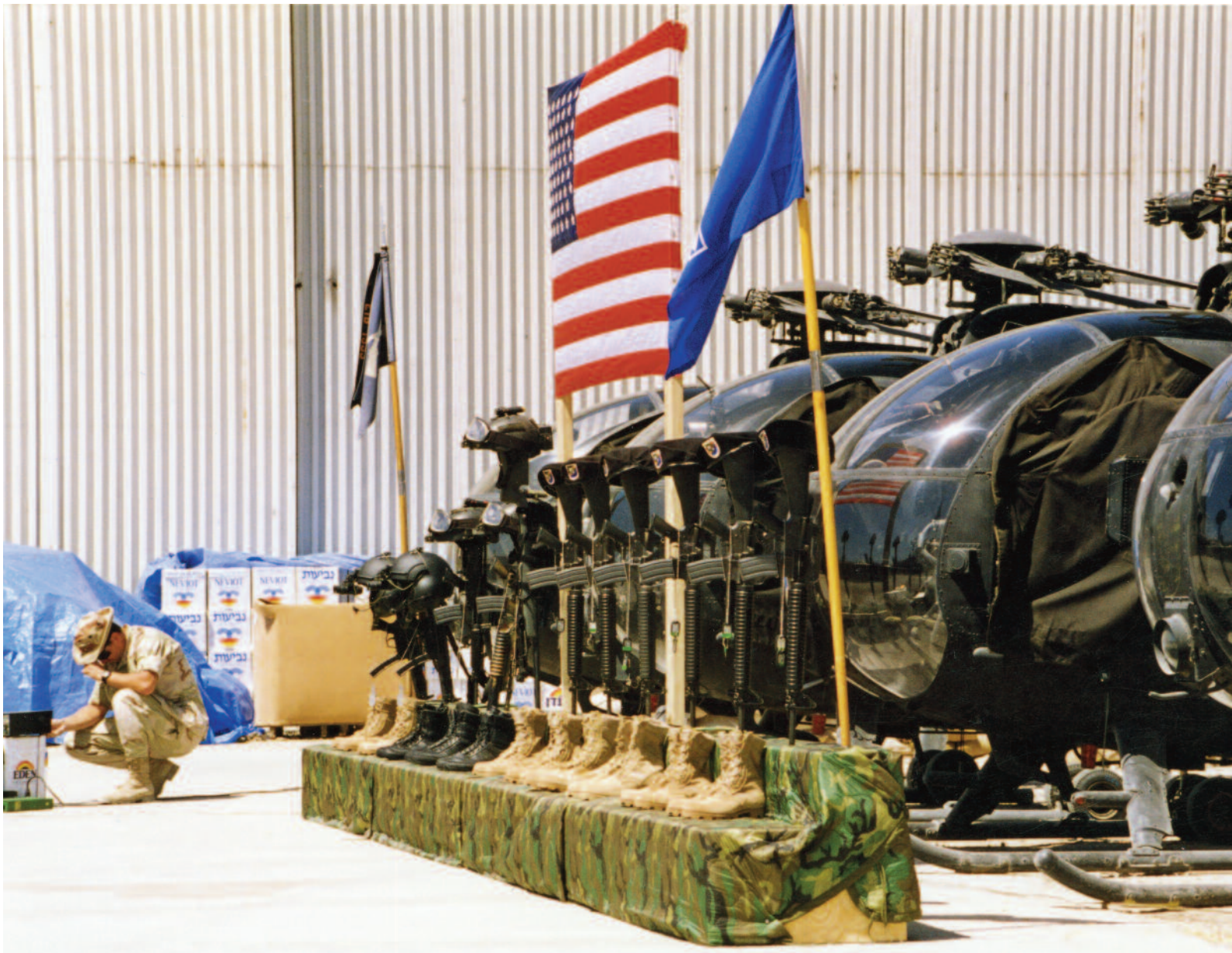
6. oktober 1993, amerikanernes minneseremoni for 11 falne US Rangers. Senere mer kjent som the Black Hawk Down.