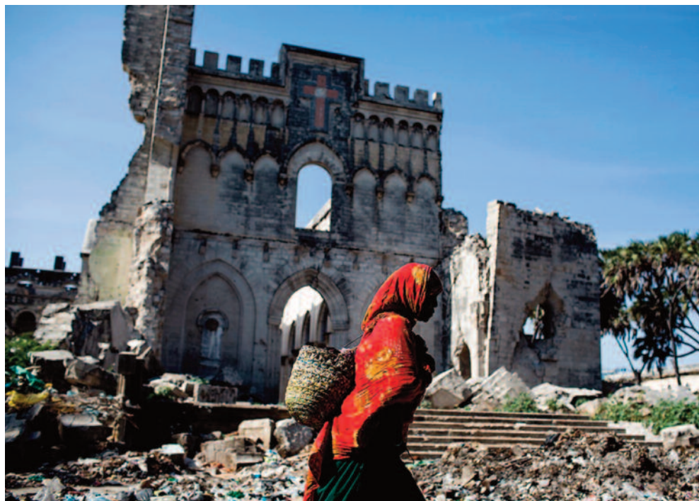
Under: Ruiner av katedralen i Mogadishu

kene i Somalia skulle innstille jakten på Mohamed Farrah Aidid, fokusere mindre på militære løsninger og mer på politiske løsninger, og forberede seg på uttrekning fra Somalia innen 31. mars 1994. Clintons beslutning om å innstille jakten på Aidid ble avgjørende for at nesten samtlige UNOSOM-bidragstende land bestemte seg for å gjøre det samme. UNOSOMs mulighet for å bruke vold ble ikke formelt trukket tilbake, men innholdet døde så å si hen av seg selv da de nasjonale kontingentene i UNOSOM bestemte seg for å følge USAs eksempel. Aidid på sin side fryktet et amerikansk gjengjeldelsesangrep. Bare få dager etter slaget i Mogadishu inngikk han en ensidig våpenhvile med amerikanerne. Norge fulgte eksempelet til USA og de fleste UNOSOM-land og bestemte seg for å trekke ut styr-