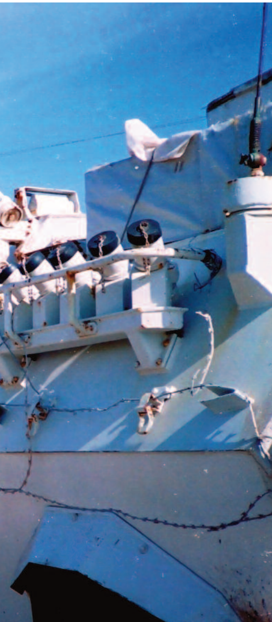
Til venstre: PPK fra Malaysia. To av disse ble skutt sønder og sammen under "The Battle of Mogadishu" når de prøvde å hjelpe amerikanerne.