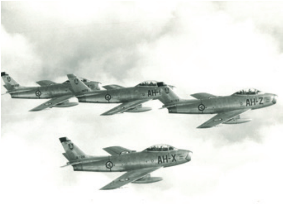
Fire F-86F fra 332-skvadron i formasjon.

Luftforsvarets betegnelse som en taktisk flystyrke henviser til den støttende rollen styrken skulle ha i USAs atomstrategi. I denne sammenhengen var bruken av beskrivelsen taktisk ensbetydende med offensiv bruk av jagerfly inn mot Øst-Europa. Denne rollen og disse oppdragene hadde høyeste prioritet, høyere enn invasjonforsvaret.