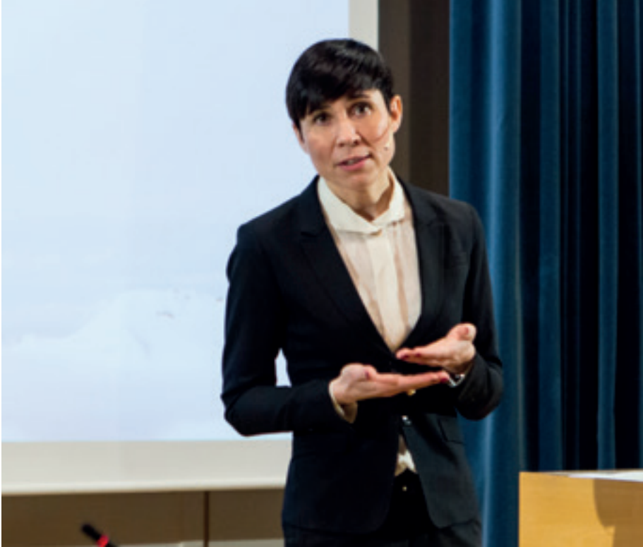
Daværende forsvarsminister Ine Eriksen Søreide på Luftmaktseminaret i 2017.

hovedlinjen i seminaret har vært å identifisere sentrale nasjonale og internasjonale utviklingstrekk, og deretter debattere hvor norsk luftmakt bør gå, gitt disse utviklingstrekkene.