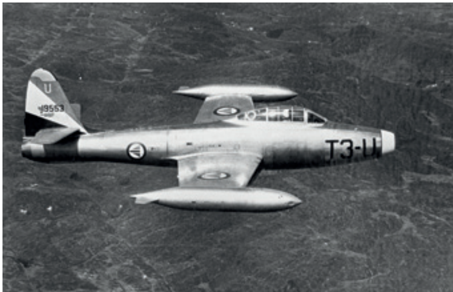
Et av Luftforsvarets F-84G-fly.

(TAFNORNOR) med utgangspunkt i Bodø/Bardufoss, i tillegg til 338-skvadronens faste oppdrag for Third Air Force Task Force North (3 AFTFN) med utgangspunkt på Ørland.