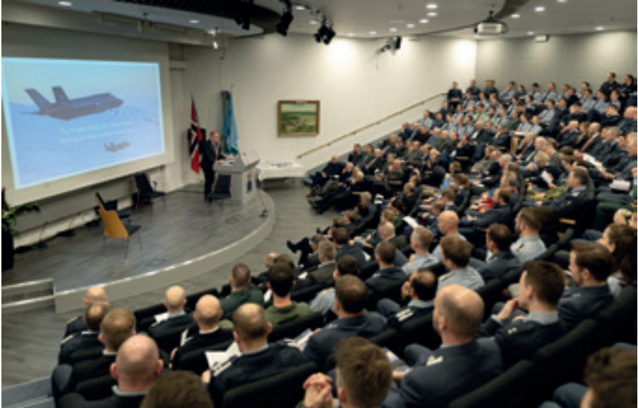
Fra Luftmaktseminaret 2020.