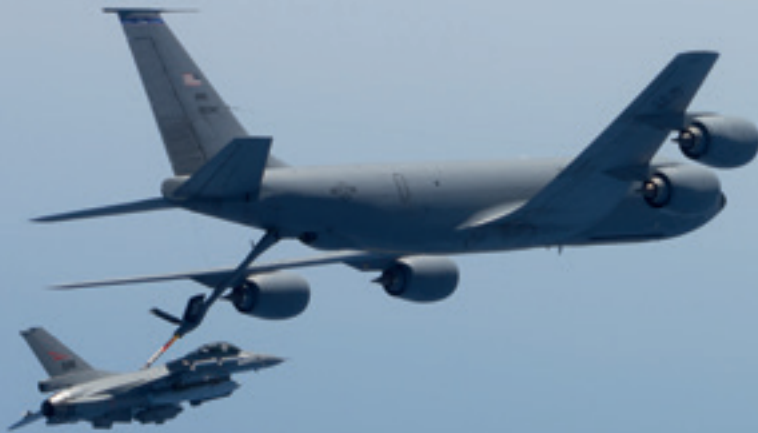
En norsk F-16 fyller drivstoff fra en KC-10 under operasjonene mot Libya i 2011.

De relativt markante endringene etter 2014, og herunder NMS fra mai 2019, må sees blant annet på bakgrunn av Russlands betydelige modernisering og styrking av sine militære kapasiteter. I en rapport i 2017 skrev FFI at «Russlands væpnede styrker er i dag bedre utstyrt, bedre trent og mer mobile enn de var da forsvarsmoderniseringen startet i 2008». 13 Med den folkerettsstridige okkupasjonen og anneksjonen av Krim i 2014 viste Russland evne til å fremføre styrker på meget kort tid og vilje til å bruke militærmakt for å nå sine mål. Russland brukte også ikke-militære virkemidler og propaganda for å påvirke befolkningen og svekke grunnlaget for væpnet motstand fra ukrainsk side. Russisk militær trenings- og øvingsaktivitet ligger på et jevnt høyt nivå, og særlig under krigen i Ukraina i 2014 og i «out-of-area»-operasjonene i Syria fra 2015 og fremover har Russland høstet verdifulle erfaringer i bruk av nye og moderniserte kapasiteter og våpen.