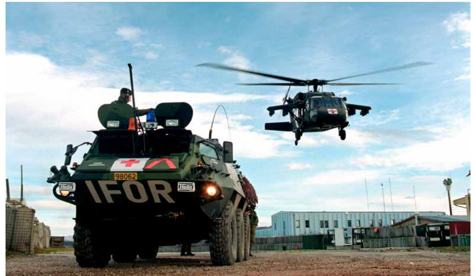
BOSNIA: En norsk Sisu og et amerikansk Black Hawk-helikopter på flyplassen i Tuzla under krigen i Bosnia.

En konflikt tre parter. Tilsynelatende foregikk det fra sommeren 1992 en væpnet konflikt i Kroatia og en i Bosnia-Hercegovina, men i realiteten var det en konflikt med minst tre parter. Den militært sterkeste parten var det serbisk-dominerte Rest-Jugoslavia under Slobodan Milosevic, som utøvet de facto kontroll over de serbiske utbryterrepublikkene i Kroatia og Bosnia. Milosevic ønsket å etablere levedyktige serbiske