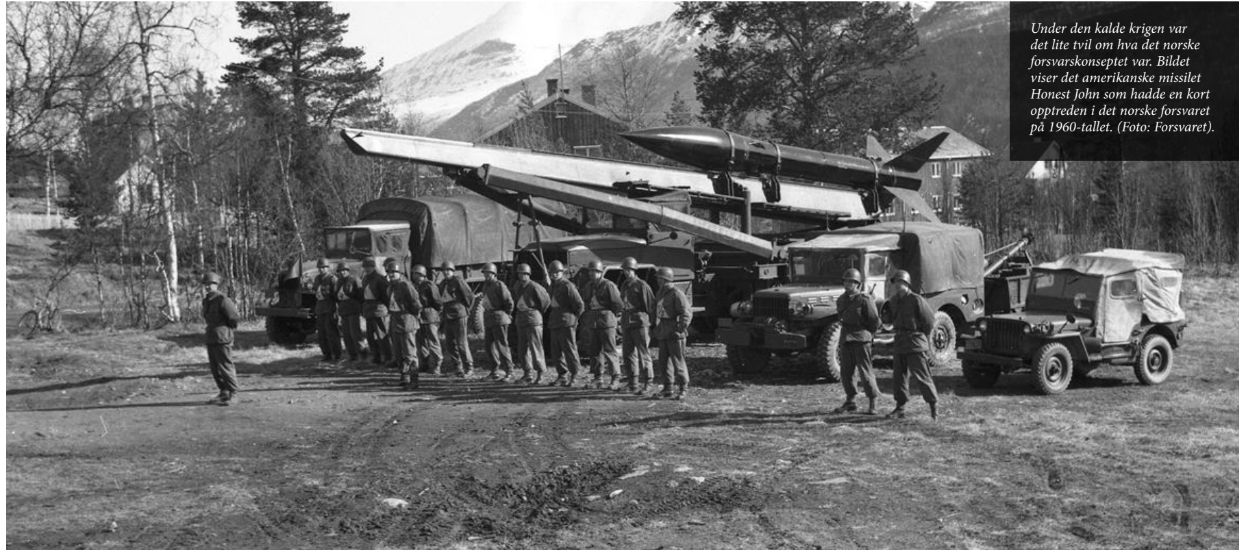
Under den kalde krigen var det lite tvil om hva det norske forsvarskonseptet var. Bildet viser det amerikanske missilet Honest John som hadde en kort opptreden i det norske forsvaret på 1960-tallet.

Et avsluttende men viktig spørsmål, er likevel om småstaten Norge i det hele tatt bør ha et eget forsvarskonsept? Hvor stor handlefrihet har egentlig Norge til å utvikle et eget nasjonalt forsvarskonsept innenfor