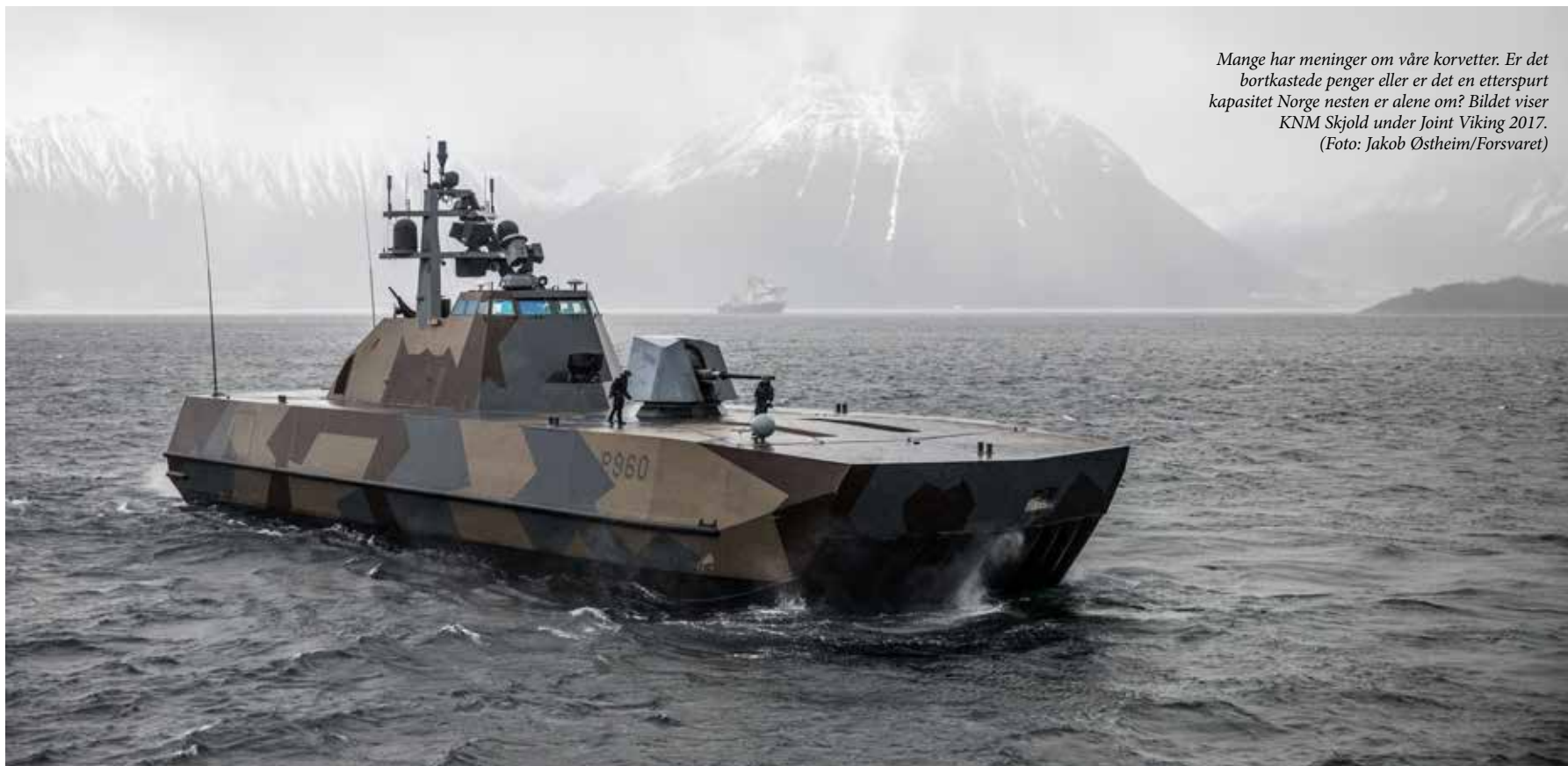
Mange har meninger om våre korvetter. Er det bortkastede penger eller er det en etterspurt kapasitet Norge nesten er alene om? Bildet viser KNM Skjold under Joint Viking 2017.

som kystkorvetter – som startet i siste halvdel av 1990-tallet. Fartøyene ble levert mellom 2006 og 2009. Både forsvarssjefen og forsvarspolitisk utvalgte mente i 2007 at prosjektet var blitt for dyrt og var dårlig tilpasset det nye trusselbildet, men anskaffelsen ble likevel fullført. I 2016 besluttet regjeringen – på anbefaling fra forsvarssjefen – at Skjold-klassen skulle avvikles «anslagsvis fra 2025». 4 Et tredje eksempel er anskaffelsen av raketartillerisystemet M270 Multiple Launch Rocket System (MLRS) til Hæren på slutten av 1990-tallet. Anskaffelsen var en del av det ambisiøse Divisjon 2000-prosjektet, som konseptuelt ble utviklet gjennom FFIs hæranalyse, utredninger i regi av Hærstaben i Forsvarets overkommando (Hovland-utvalget) og med forankring i forsvarssjefens forsvarsstudier på 1990-tallet. Systemet