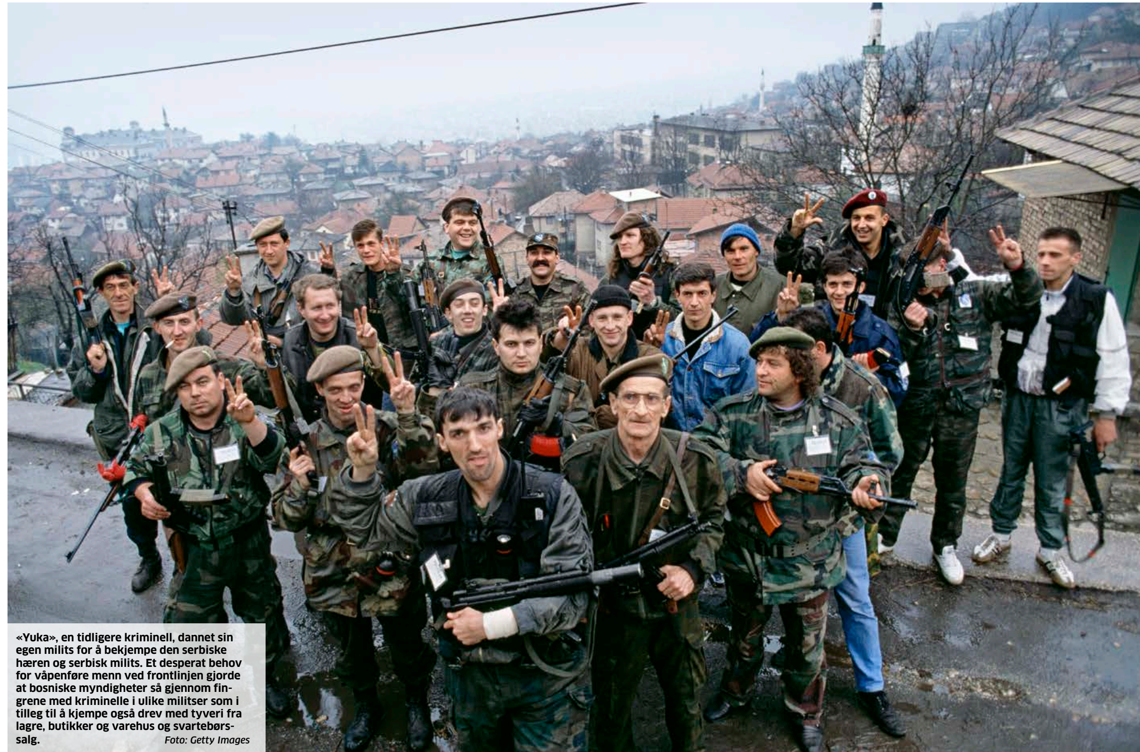
«Yuka», en tidligere kriminell, dannet sin egen milits for å bekjempe den serbiske hæren og serbisk milits. Et desperat behov for våpenføre menn ved frontlinjen gjorde at bosniske myndigheter så gjennom fingrene med kriminelle i ulike militser som i tillegg til å kjempe også drev med tyveri fra lagre, butikker og varehus og svartebørs-salg.

lingen var ledet an av Slovenia og Kroatia, som begge erklærte seg uavhengige 25. juni 1991.