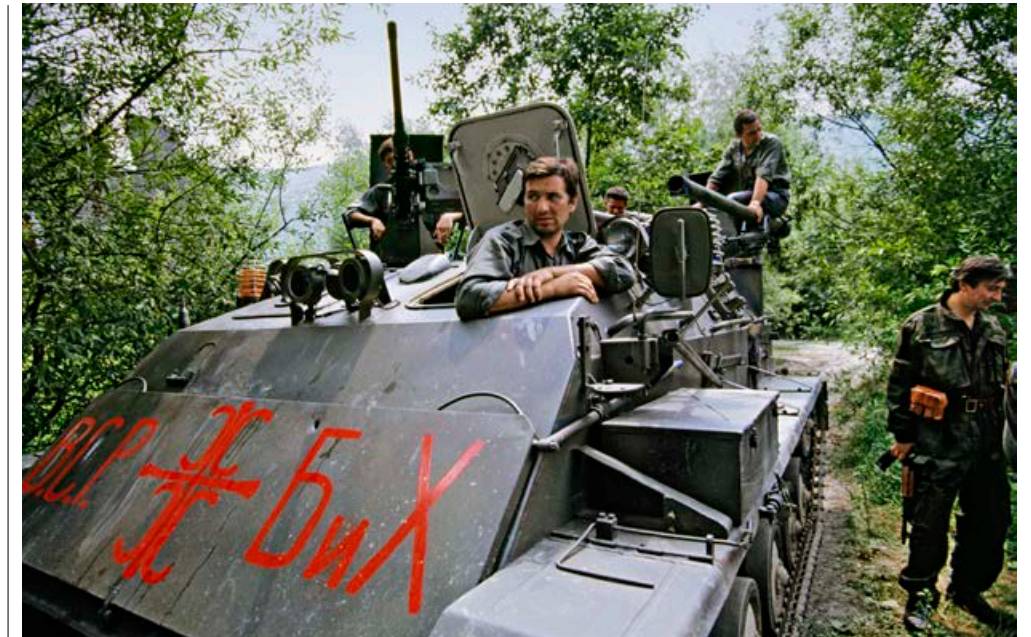
Fra sine stillinger i åssidene rundt Sarajevo beskjøt serbiske styrker byen i nesten fire år. De var i mindretall, men hadde bedre våpen og utstyr.

Da de norske FN-soldatene ankom Sarajevo, var byen en fredelig plass hvor nordmennene kunne spasere ubevåpnet rundt i gatene om