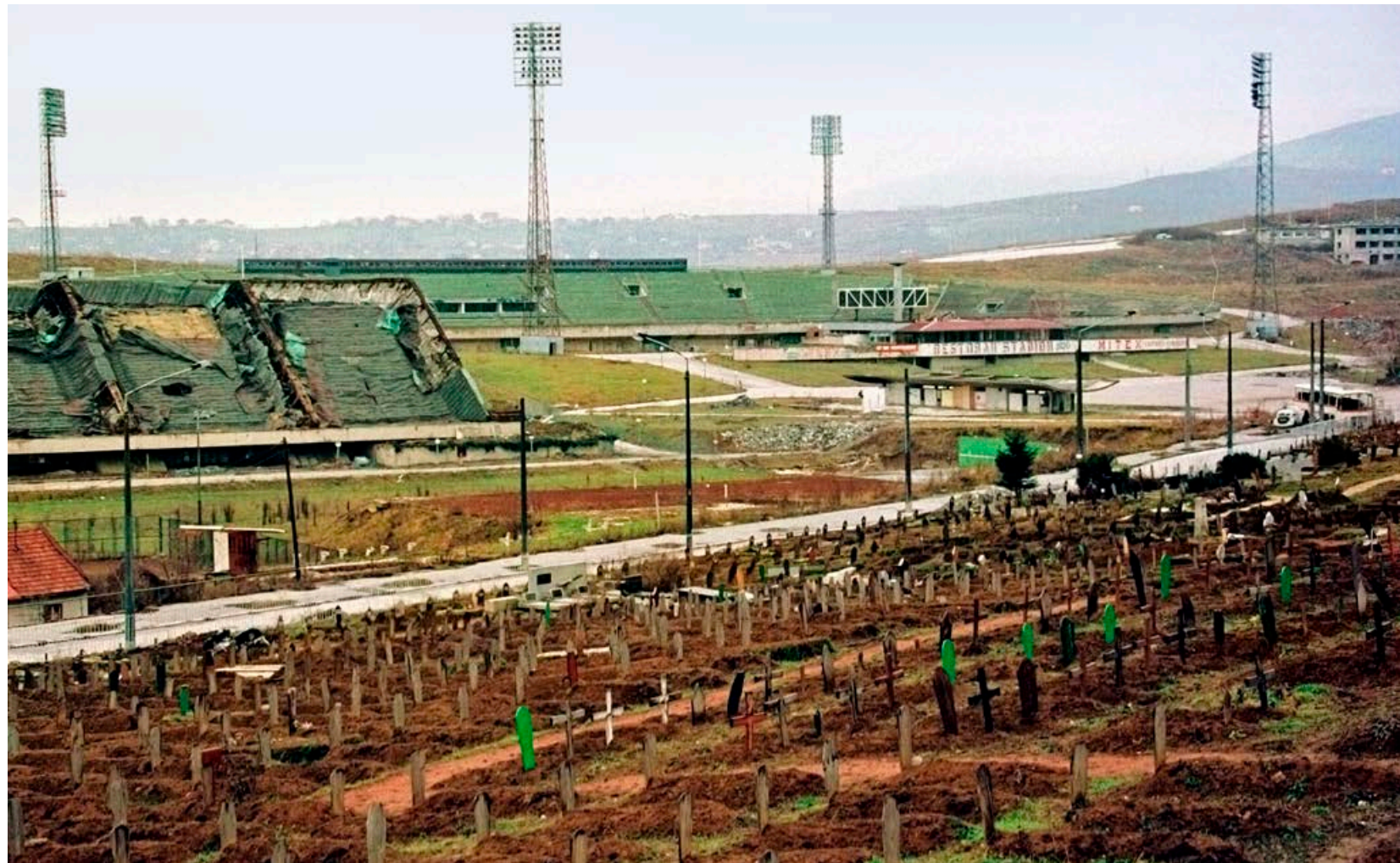
I 1984 ble det arrangert vinter-OL i Sarajevo. Ti år senere så OL-stadion slik ut. Deler av anlegget ble brukt som krigskirkegård.

full fart kjørte forbi en gruppe sivilister. To mennesker ble liggende skadet igjen. De ble evakuert til inngangen av det norske hovedkvarteret og gitt sanitetshjelp, før nordmennene fraktet dem videre til et sivil sykehus. Også dagen etter, den 22. april, evakuerte ambulanselaget skadede fra gaten og inn til det lokale sykehuset. Til sammen ble et 20-tall sårede og døde evakuert med norsk hjelp fra gatene i Sarajevo og til sykehus. Flere ganger måtte nordmennene, med akutt fare for eget liv, kjøre gjennom områdene hvor kampene herjet.