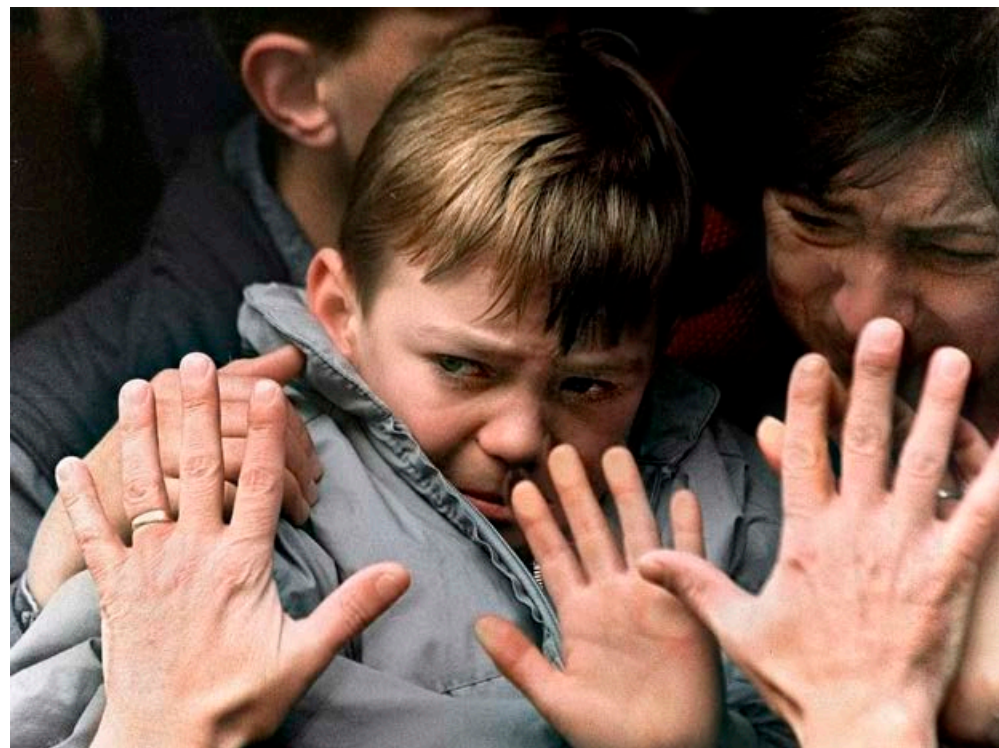
En far presser hånden mot bussvinduet idet den gråtende sønnen og hustruen blir transportert ut i sikkerhet fra Sarajevo i november 1992. Krigen i Bosnia var uoversiktlig. Katolske kroater, bosnisk-muslimske grupperinger og serbere kjempet i en krig hvor alliansene skiftet opptil flere ganger. I hovedsak kjempet kroater og bosniere mot serbere. Men det forekom også allianser mellom serbere og kroater, og i enkelte tilfeller mellom serbere og bosnjaker.

Den største redningsaksjonen utførte nordmennene sammen med svenskene i vaktkompaniet JK01. I utkanten av Sarajevo lå et sykehus som var kommet under beskytning. For å evakuere pasientene sendte svenskene pansrede kjøretøyer hit. En norsk ambulanse og seks norske FN-soldater var med svenskene. Da FN-styrken kom frem, viste det seg at snikskyttere hadde forskanset seg i de øverste etasjene av sykehuset. Flere bosnisk-serbiske soldater lå døde utenfor, drept av snikskytterne. I et inferno av skyting og brann fikk FN-soldatene reddet ut alle de 60 pasientene fra sykehuset.