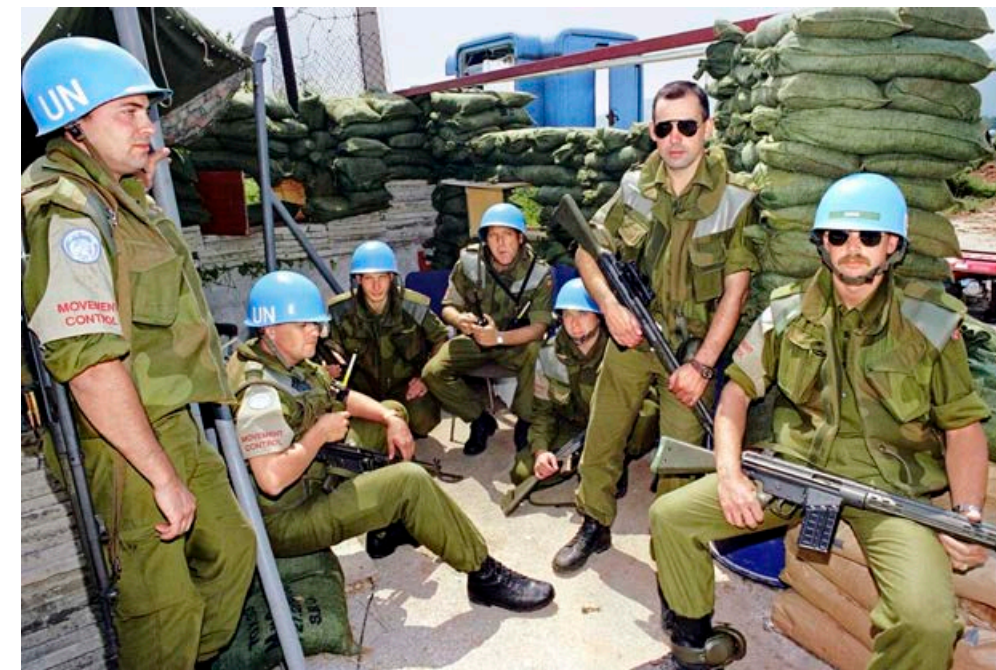
UNPROFOR, inkludert en tropp norske FN-soldater, returnerte til flyplassen i Sarajevo i juli 1992 for å sikre flyplassen for innflyvning av nødhjelp.