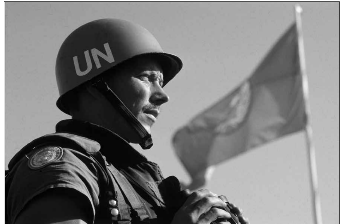
Under den kalde krigen var nordisk forsvarssamarbeid i stor grad avgrenset til deltakelse i FN's fredsbevarende operasjoner.

Likevel ble et sivilt nordisk samarbeid utviklet på