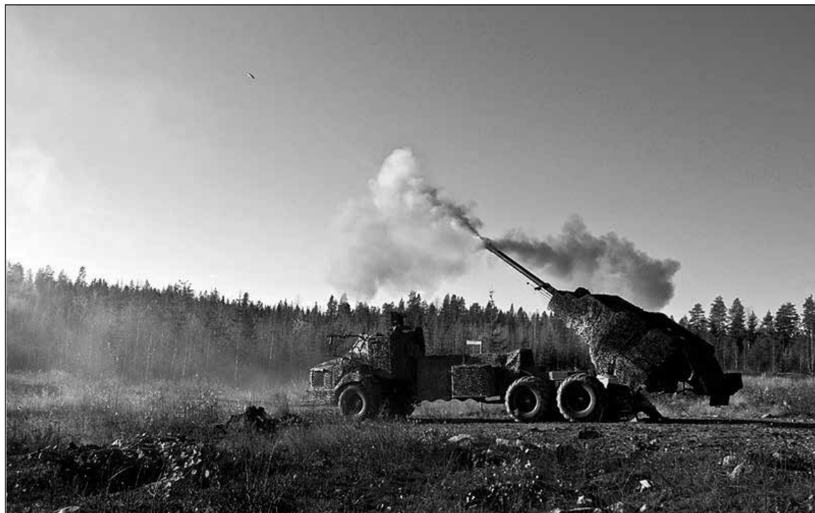
Den norske kanselleringen av artillerisystemet Archer i desember 2013 var et stort tilbakeslag for norsk-svensk samarbeid.

Sveriges forsvarsminister Sten Tolgfors uttalte at «det hadde vært svært viktig for det svensk-norske forsvarsarbeidet om Norge hadde valgt Grippen». 37