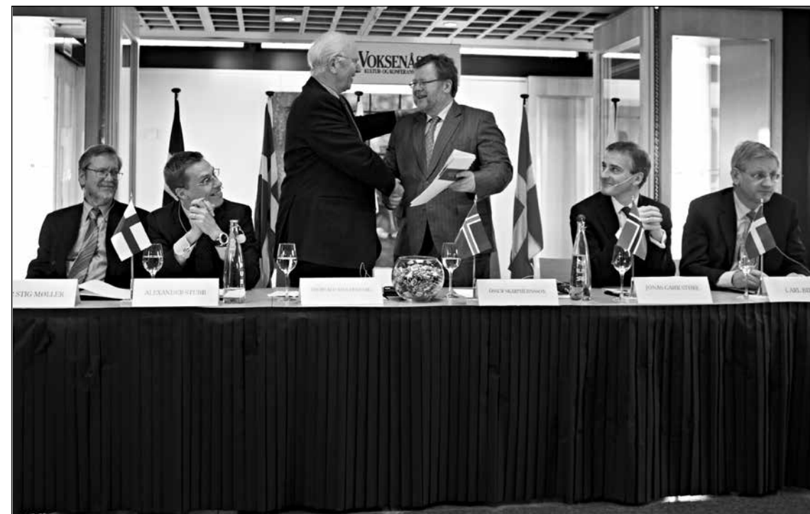
I februar 2009 ble «Stoltenberg-rapporten» overlevert de nordiske utenriksministrene.

Mens danskene forble på utsiden møtte det norsk-svensk-finske samarbeidet store utfordringer. Et tidlig tilbakeslag var Norges beslutning i november 2008 om å erstatte sine F-16-kampfly med det amerikanske F-35. Det svenske JAS-39 Gripen NG var den andre kandidaten. F-35 ble vurdert som både militærfaglig bedre og prismessig gunstigere enn Gripen. 36 Sveriges statsminister Fredrik Reinfeldt uttalte at han var «skuffet og overrasket» og karakteriserte valget som «et tilbakeslag for våre ambisjoner om å utvikle nordiske løsninger».