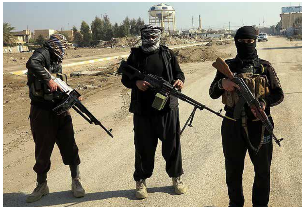
Kan bekjempelsen av IS lede til enda større problemer?

Sunni-Sjia skillelinjene synes å dominere dagens konfliktbilde, men andre faktorer som etnisitet (arabere, tyrkere, persere) og klassiske maktrelasjoner er også til stede. Om, eller når, Sunni eller Sjia grupperinger i Syria, og delvis Irak, får økt innflytelse – så er det store sjanser for at regionale aktører prøver å balansere dette med støtte til den andre religiøse grupperingen, noe vi allerede har sett eksempler på.