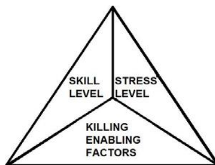
Figur 1: Task Triangle, Murray 2004

Disse faktorene er: Autoritet, gruppeabsolusjon 1 , predisposisjon, fysisk avstand, emosjonell avstand og målets attraktivitet. En annen person som støtter Grossman sine teorier om dette temaet er Kenneth R.