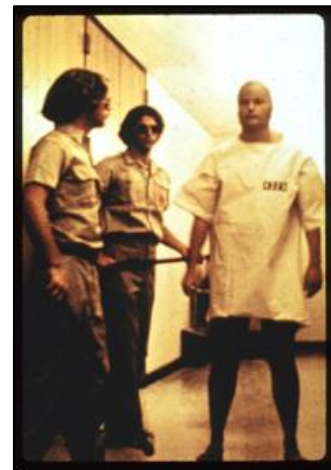
Viser hvordan vaktene og fangene var kledd under eksperimentet

Zimbardo måtte avbryte forsøket etter kun 6 dager da flere av fangene hadde blitt sendt hjem på grunn av sykdom som følge av psykisk press. Skillet mellom virkelighet og eksperiment ble visket kraftig ut for vakter og fanger. Dette gjorde det vanskelig å skille hvilke situasjoner som var del av eksperimentet og hvilke som var fra virkeligheten. En av grunnene til at forsøket ble avsluttet var at vaktene hadde begynt å eskalere maktbruken mot fangene midt på natten da de trodde ingen fulgte med. Deltakerne ble kledd opp i standard uniformer eller drakter ut ifra rollen de