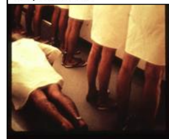
Viser stressende stillinger og armhevinger som straff