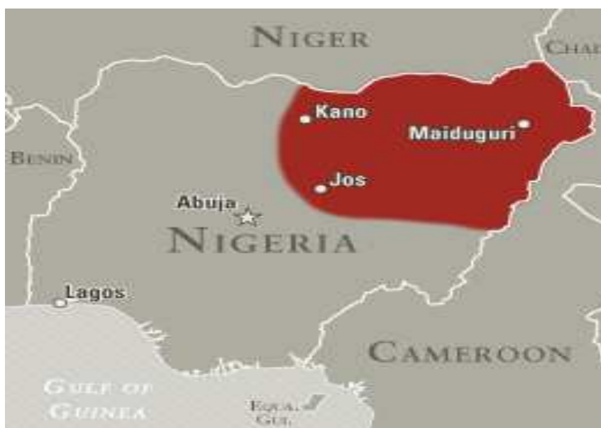
Boko Haram dominert område i Nigeria (NCTC, 2013)

Av dette ser man at det finnes mange incentiver for at voldelige opprør og ekstremisme kan vokse fram. Når det i tillegg dukket opp en karismatisk leder, Mohammed Yusuf, for en muslimsk sekt i nord på begynnelsen av 2000 tallet er mange av Bjørgos (2005) grunner til terrorisme og opprør oppfylt (Bøås, 2012 b, s3; Zenn, 2012, Intro).